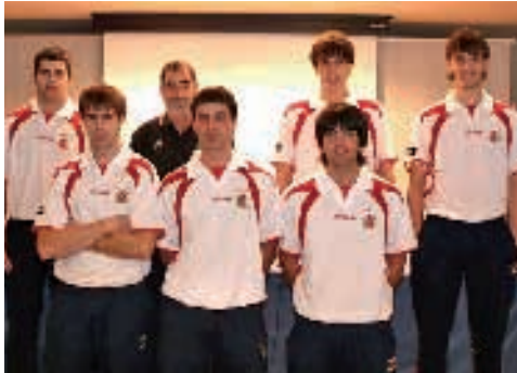
Delegación Española en el Campeonato del Mundo de Pelota sub 22