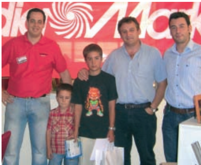
Entrega de premios

La convocatoria de este concurso de fotografía responde al interés del Gobierno de La Rioja, a través de la Consejería de Educación, Cultura y Deporte y la Fundación Rioja Deporte, de vincular la práctica deportiva a distintas manifestaciones artísticas.