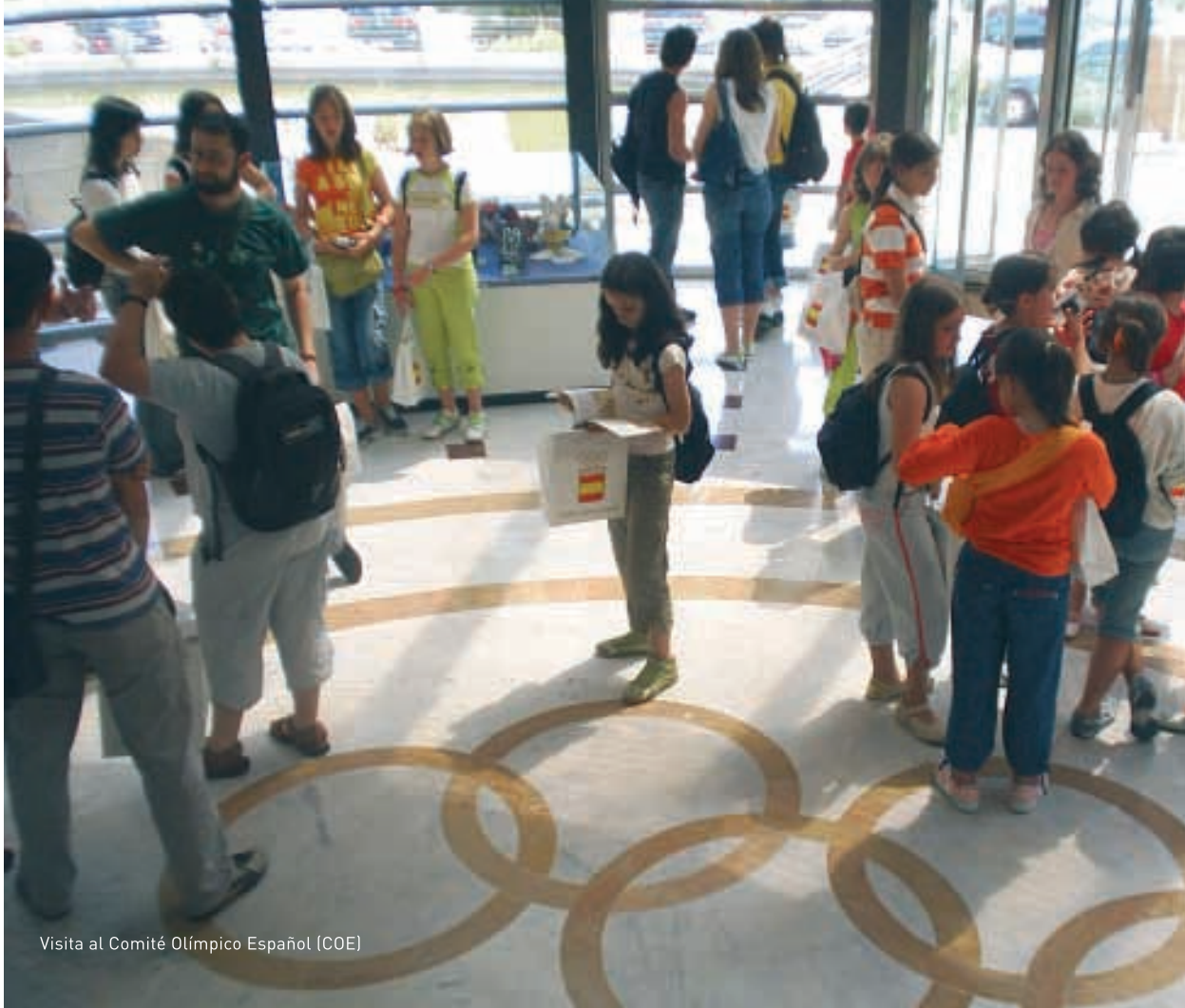
Visita al Comité Olímpico Español (COE)

En este ciclo, dirigido a los escolares riojanos, se proyectaron cuatro películas de temática deportiva (Sea Biscuit, Días de fútbol, Quiero ser como Beckham y Una pandilla de altura). Más de 400 jóvenes disfrutaron de las mismas. Asimismo, estuvieron en las proyecciones algunos de los deportistas becados por la Fundación, que compartieron coloquio con los asistentes.