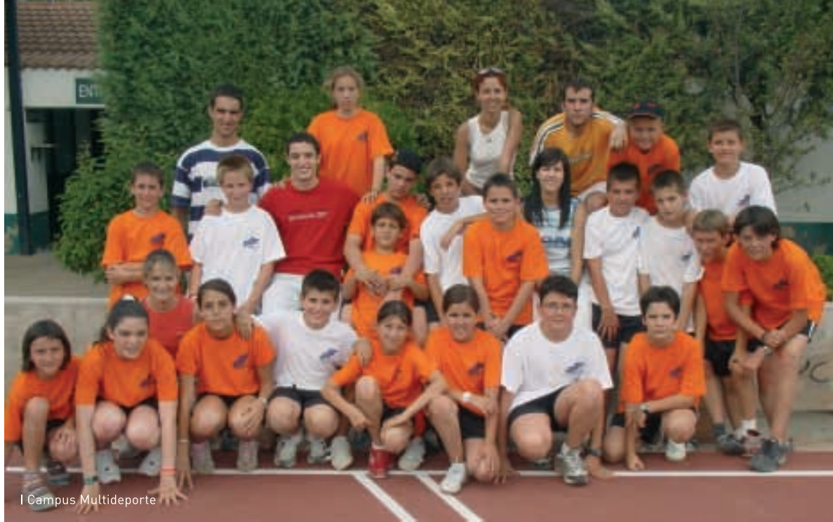
I Campus Multideporte

En este encuentro se aprobaron los presupuestos generales de la Fundación para 2006.