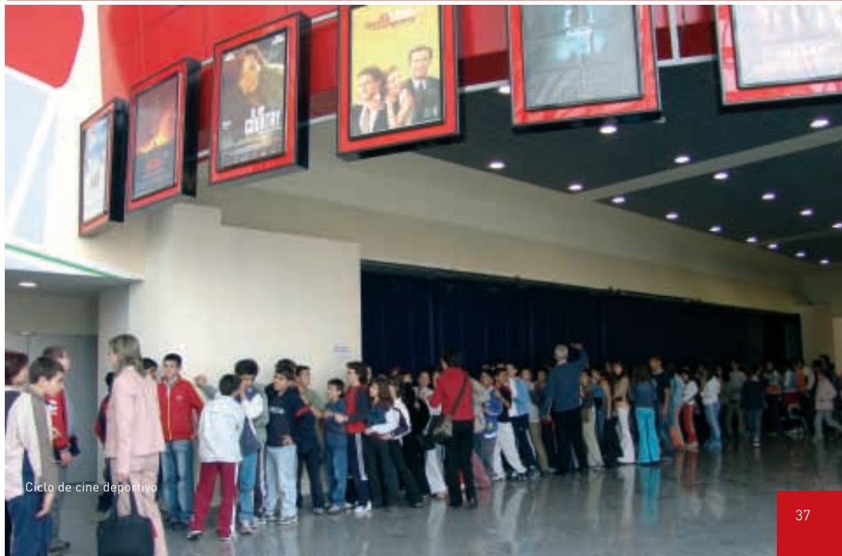
Ciclo de cine deportivo

En 2005, la Fundación Rioja Deporte amplió sustancialmente su nómina de deportistas becados, así como la cuantía de las ayudas. La buena acogida que el proyecto de esta institución tiene entre el tejido empresarial de la región permite que los fondos aportados por el Gobierno de La Rioja se incrementen con capital privado. Importe total: más de 70.000 euros.