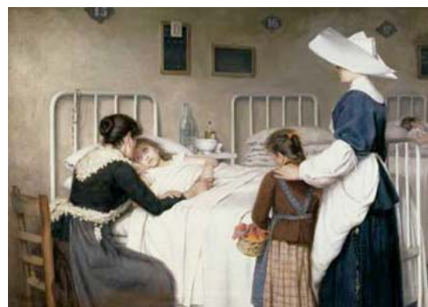
'La visita de la madre', Enrique Paternina (1932). Museo del Prado

A lo largo de su vida regresó con frecuencia a Haro para cumplir con sus obligaciones familiares derivadas de su condición de burgués acomodado. Aunque esta situación cambió tras la llegada de la filoxera a La Rioja, ya que las complicaciones económicas surgidas a raíz de la llegada de la plaga obligaron al pintor a permanecer de manera más estable en Haro, donde desarrolló la última parte de su producción.