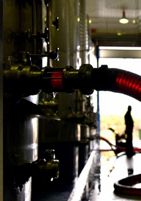
Trasiego del clarete en la cooperativa San Cebrián de San Asensio.