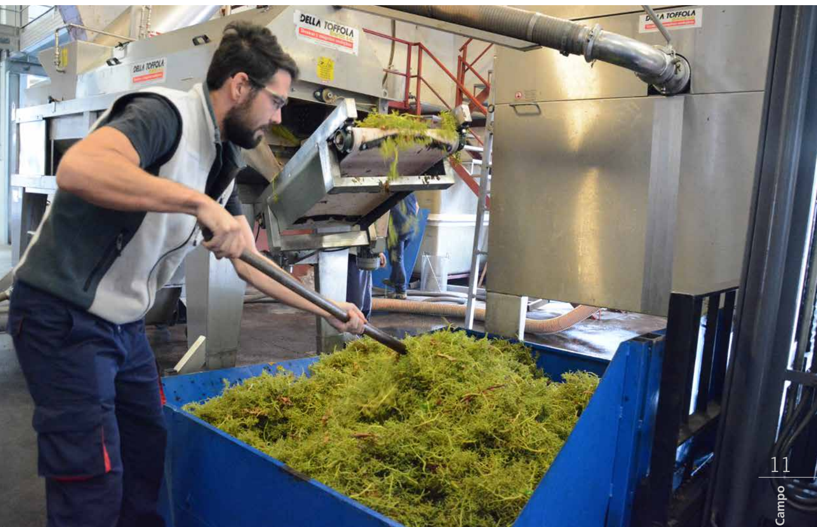
Despalillado de uva blanca de Viura.