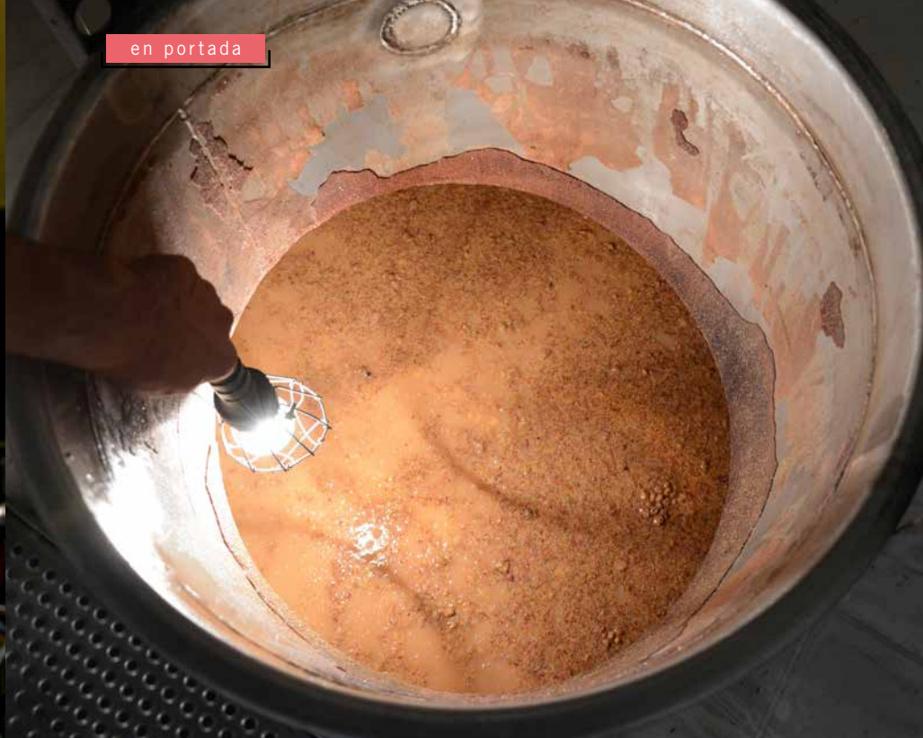
Proceso de fermentación, donde se aprecia el color pálido del clarete.

que el mosto limpio se deposite en la parte inferior del depósito. Tan limpio queda el mosto que es preciso, al trasegar el vino a otro depósito para hacer la fermentación, incorporar un poco de turbio para que las levaduras se desarrollen bien y no haya problemas con la fermentación. “Son vinos muy exigentes en la entrada de la uva en la bodega porque requieren hacer este proceso muy rápido. En apenas 48 horas el mosto ya está fermentando”, aclara el enólogo.