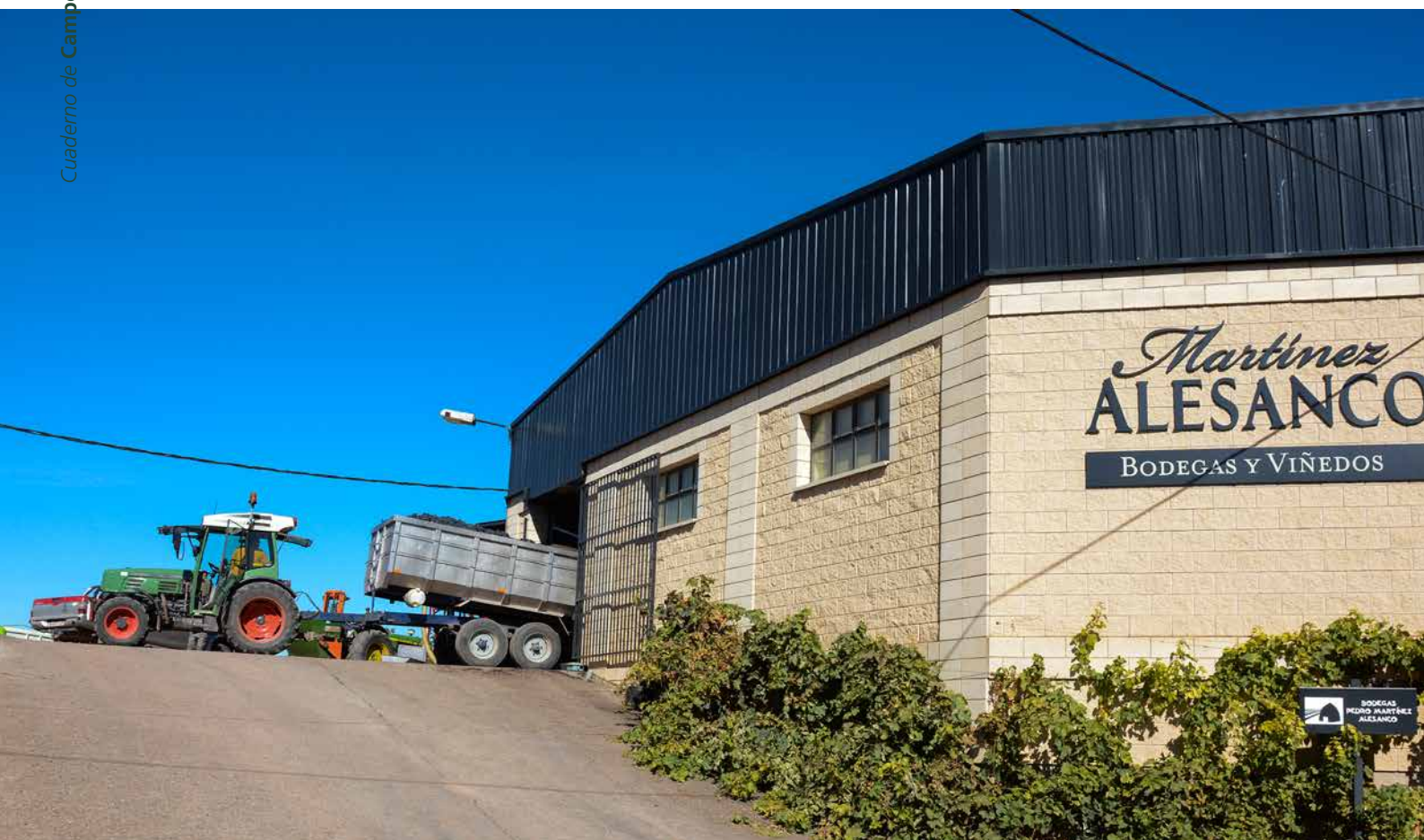
Descarga de la uva en Martínez Alesanco.