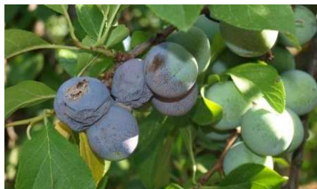
Monilia en ciruela Claudia

Próximo a la recolección pueden aparecer podredumbres causadas por esta enfermedad por lo que para intentar evitarlo utilizaremos alguno de los productos recomenda-dos en el boletín nº 4.