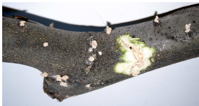
Salida de adultos de barrenillo.

Una técnica cultural de lucha eficaz contra esta plaga consiste en dejar repartidos por toda la plantación montones de restos de poda para que los barrenillos realicen en ellos la puesta y luego eliminarlos, hacia la primera quincena de mayo antes de que los nuevos barrenillos los abandonen.