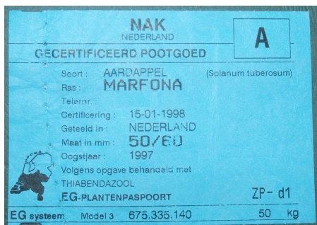
Etiqueta de patata certificada.