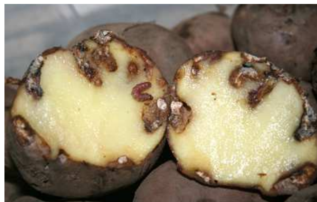
Tubérculo dañado por Tecia solanivora.

El único hospedante identificado hasta la fecha es la patata, atacando al cultivo tanto en campo como en almacén. Los síntomas que producen las larvas sobre los tubérculos, son galerías, superficiales inicialmente y que van aumentando en profundidad posteriormente. Su presencia pasa desapercibida hasta el momento de la cosecha.