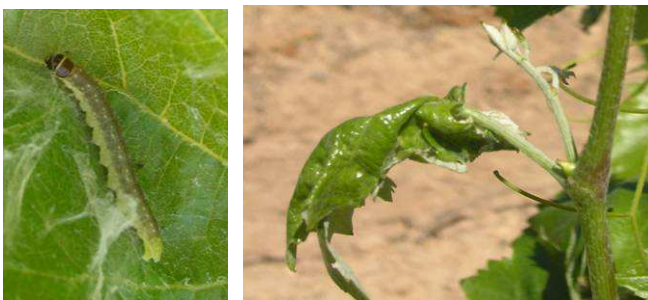
Larva y daños de piral en hoja de vid.

(*) clorpirifos puede producir fitotoxicidad en los primeros estados de desarrollo de la vid.