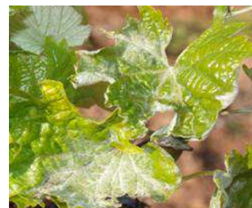
Primeros síntomas de oídio.

El período más sensible, y que debe estar protegido mediante tratamientos fitosanitarios es el comprendido entre el inicio de floración y cerramiento del racimo. No obstante, el primer tratamiento (brotes de 8-10 centímetros) es muy importante realizarlo si el año anterior hubo problemas de esta enfermedad en la parcela.