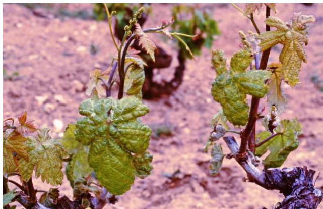
Síntomas de araña amarilla al desborre.