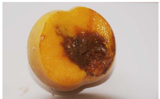
Daños y larvas de la mosca de la fruta en melocotón.

(1) Cultivo autorizado y plazo de seguridad según formulación.