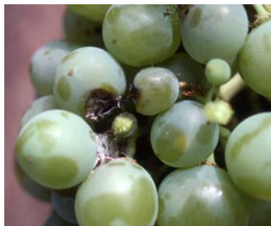
Daños de polilla del racimo en uva.

Se recuerda que para conseguir buena eficacia es indispensable utilizar atomizadores con presión suficiente para localizar el producto en los racimos, para lo cual suele ser necesario tratar a las 2 caras de la cepa.