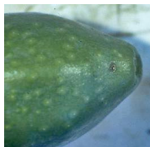
Entrada de polilla, generación carpófaga.

En los puestos de control que tenemos establecidos en varios municipios se están capturando abundantes adultos de esta plaga.