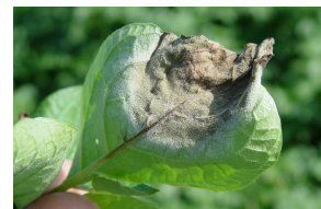
Síntomas de mildiu en hoja.

A continuación se indican los productos autorizados, así como las características de cada uno de ellos, importantes a tener en cuenta para poder controlar eficazmente la enfermedad: