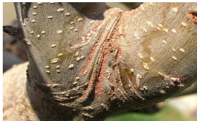
Puesta de araña roja en la inserción de una rama de manzano

En plantaciones con abundante puesta invernal es importante realizar un tratamiento con aceite de parafina (pr. común) inmediatamente antes de comenzar la eclosión de huevos siempre antes de floración. En nuestra región y en nuestras variedades este momento se corresponde con los estados fenológicos siguientes: manzano (C-C 3 : botón hinchado), melocotonero (E: se ven los estambres) y peral (C-C 3 : botón hinchado). Hay que tener en cuenta que entre el tratamiento con aceite de parafina y los productos azufre, captan, dodina, folpet y polisulfuros deben transcurrir como mínimo 21 días.