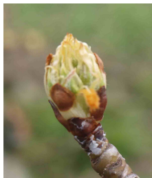
Estado fenológico C 3 .

Los tratamientos se pueden clasificar en preventivos , en cuyo caso los productos deberán usarse antes de que se produzcan las lluvias, de stop , en las 36 horas siguientes al comienzo de la lluvia y curativos , capaces de impedir el avance de la enfermedad en las 36-72 horas siguientes al comienzo de la lluvia.