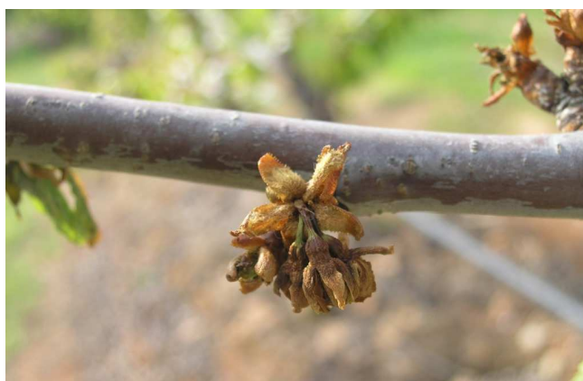
Síntomas de monilia en rama de cerezo.

Los primeros síntomas de esta enfermedad se producen en primavera provocando la marchitez de flores y brotes. Las flores quedan pegadas a los brotes.