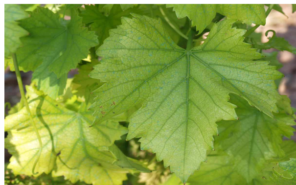
Clorosis férrica en hoja de vid.

Para obtener buena eficacia es necesario: