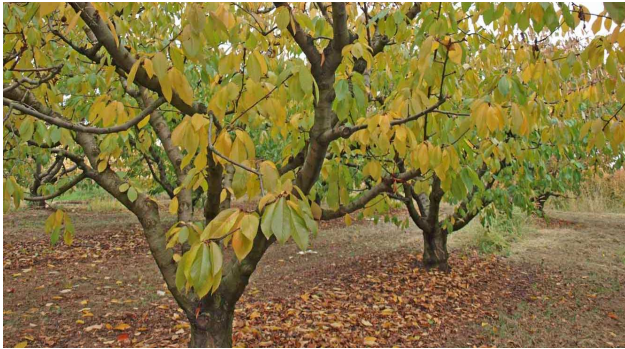
Caída de hojas en cerezo.

Al caer las hojas se producen pequeñas heridas en el punto de inserción que pueden suponer una vía de entrada de muchos hongos. Por ello les aconsejamos realizar un tratamiento con un producto cúprico cuando hayan caído aproximadamente el 50% de las hojas en frutales de pepita o el 75% de las hojas en los frutales de hueso.