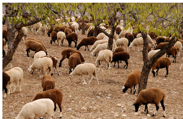
Rebaño de ovejas chamaritas en Préiano.

El incumplimiento de la obligación de señalización está considerado por la normativa como una falta muy grave.