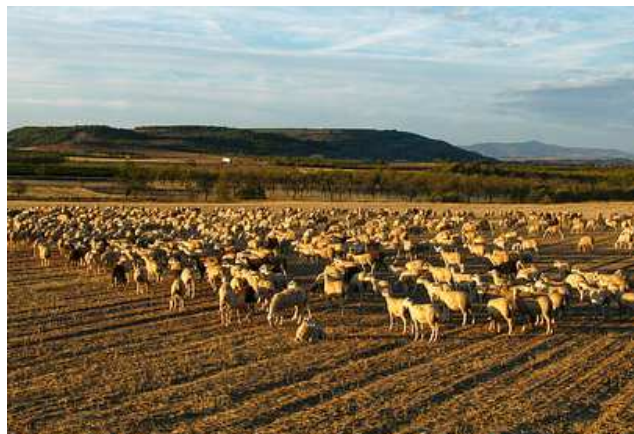
Rebaño en un rastrojo de Corera.

Con respecto al sistema de señalización, en aplicación de la Resolución de la Dirección General de Agricultura, Ganadería e Industrias Agroalimentarias, de 4 de septiembre de 1997, se realizará de la siguiente manera: