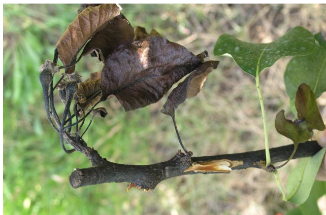
Síntomas de fuego bacteriano.

Asimismo es obligatorio la extirpación y destrucción de las partes con síntomas mediante un corte efectuado al menos a 40 centímetros del límite proximal visible de la infección y con desinfección inmediata de los útiles de poda.