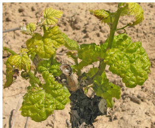
Síntomas de acariosis.

Se observa en numerosos viñedos la presencia de estos ácaros eriófidos, principalmente de erinosis, por lo que se recomienda vigilarlos y realizar tratamientos en caso necesario con azufre en espolvoreo o un acaricida autorizado.