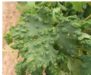
Síntomas de erinosis.