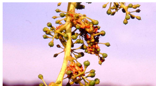
Daños de primera generación de polilla del racimo.