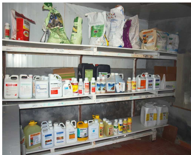
Almacén de fitosanitarios.