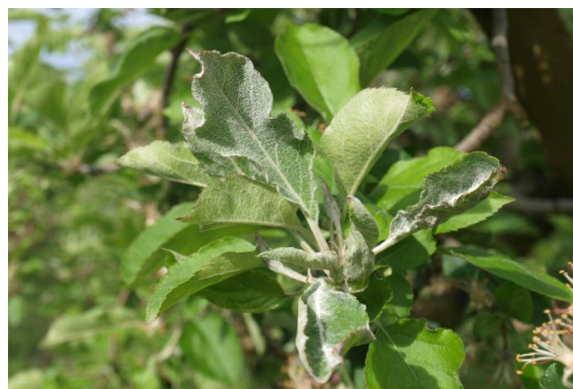
Síntomas de oídio en manzano.