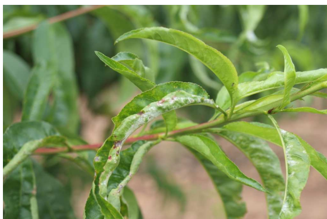
Síntomas de oídio en melocotón.