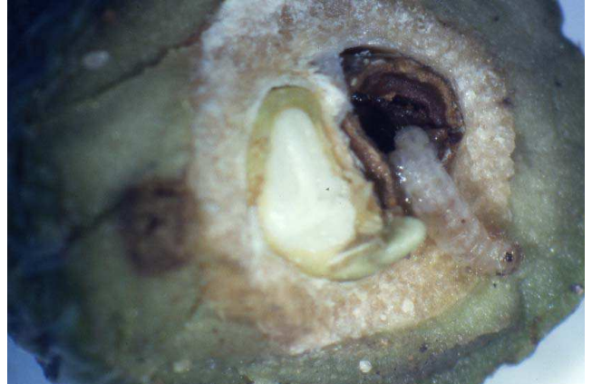
Polilla del olivo, generación carpófaga.

En los puestos de control que tenemos establecidos en varios municipios se están capturando abundantes adultos de esta plaga, con inicio de la puesta de huevos.