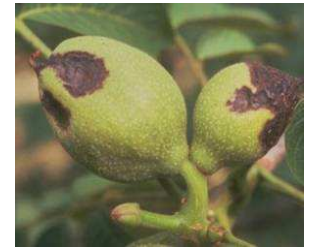
Síntomas en fruto.

Estas enfermedades se manifiestan en hojas por unas pequeñas manchas oscuras, y en frutos por unas manchas grandes negruzcas que penetran profundamente en la cáscara en caso de bacteriosis.