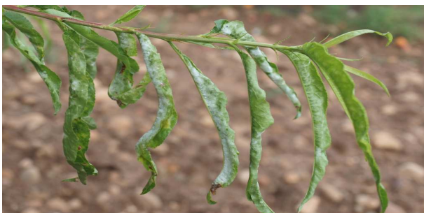
Síntomas de oídio en melocotón.

No se deben descuidar los tratamientos contra esta enfermedad en estos momentos, utilizando alguno de los productos indicados en el Boletín nº 9.