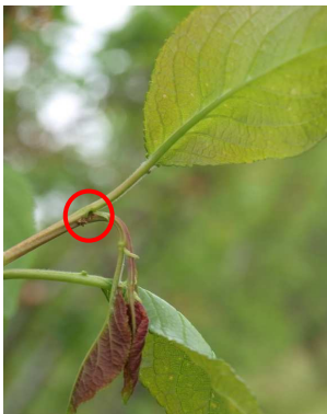
Orificio de entrada de anarsia.