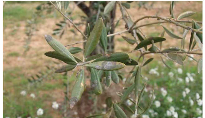
Síntomas de fructificación de repilo.

Este hongo que provoca la caída de hojas, se desarrolla con lluvias y temperaturas suaves, si se dan estas condiciones es recomendable un tratamiento preventivo con los productos recomendados en el Boletín nº 6.