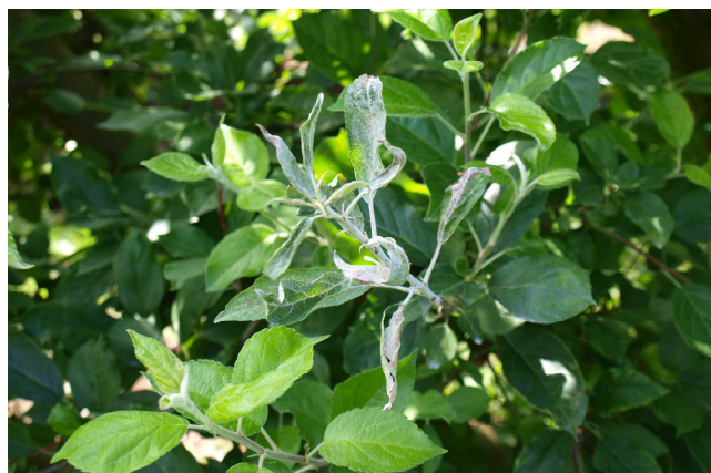
Síntomas de oídio en manzano.

Se recomienda mantener protegidas las plantaciones, realizando un tratamiento con alguno de los productos indicados en el Boletín nº 9.