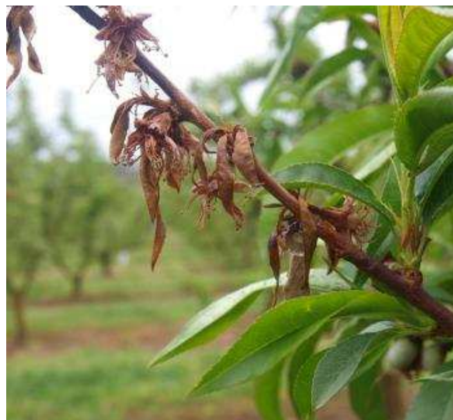
Síntomas de monilia en rama de melocotón.