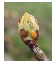
Estado fenológico C 3 .

Los tratamientos se pueden clasificar en preventivos , en cuyo caso los productos deberán usarse antes de que se produzcan las lluvias, de stop , en las 36 horas siguientes al comienzo de la lluvia y curativos , capaces de impedir el avance de la enfermedad en las 36-72 horas siguientes al comienzo de la lluvia.