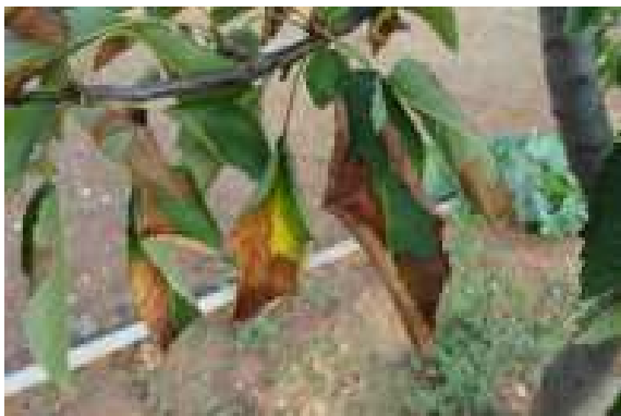
Síntomas en cerezo ( Prunus avium ) en el Sur de Italia