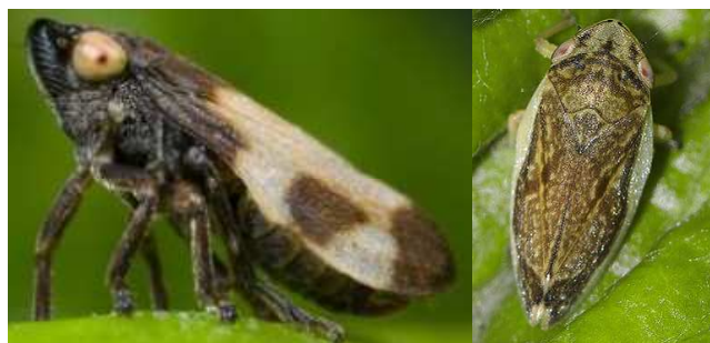
Vector de X. fastidiosa en Italia: Philaenus spumarius (Aphrophoridae).

La bacteria se transmite de una planta a otra mediante la acción de insectos vectores, principalmente cicadélidos y cercópodos, que son hemípteros chupadores que se alimentan del xilema. La especificidad entre la bacteria y el vector es muy baja, por lo que cualquier insecto que se alimente del xilema es un vector potencial de la enfermedad.