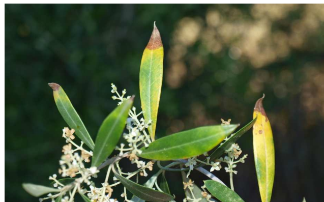
Síntomas observados en olivos en Mallorca.

Estos síntomas no siempre se relacionan con la enfermedad ya que pueden asociarse fácilmente con estrés hídrico o carencias nutricionales. Ante cualquier sospecha de síntomas deben realizarse análisis en el Laboratorio Regional de La Grajera.