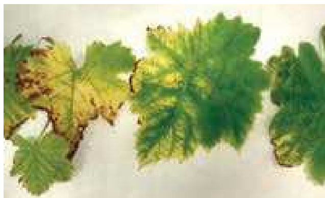
Síntomas observados en viña en Mallorca.