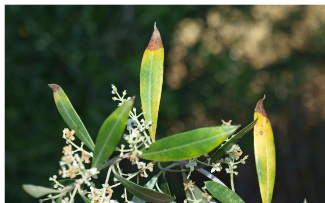
Síntomas observados en olivos en Mallorca.

Estos síntomas no siempre se relacionan con la enfermedad ya que pueden asociarse fácilmente con estrés hídrico o carencias nutricionales. Ante cualquier sospecha de síntomas deben realizarse análisis en el Laboratorio Regional de La Grajera.