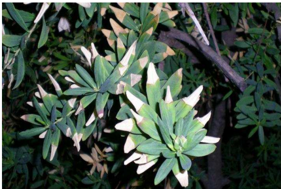
Síntomas en Polygala myrtifolia .