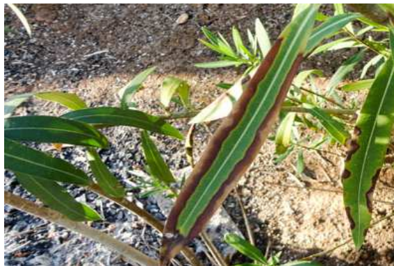
Síntomas en Adelfa ( Nerium oleander ).