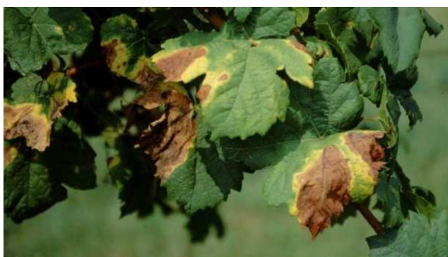
Necrosis y marchitamiento provocado por la enfermedad de Pierce en viñedo.

El rango de hospedantes de esta bacteria es muy amplio, pudiendo afectar a más de 300 especies, en muchas de las cuales no presenta síntomas aparentes pero pueden actuar como reservorio de la misma. Entre las especies en las que provoca daños se encuentran: vid ( Vitis spp.), almendro ( Prunus dulcis ), melocotón ( P. pérsica ), cerezo ( P. avium ), ciruelo ( P. domestica ), olivo ( Olea europaea ), café ( Coffea spp.), lechera del cabo ( Polygala myrtifolia ), alfalfa ( Medicago sativa ), Quercus , romero ( Rosmarinus officinalis ), etc.