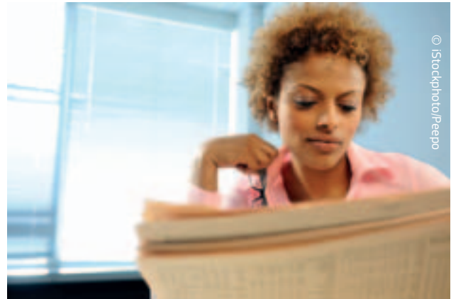
Europa necesita nuevas empresas.

En los próximos años, la Comisión pretende también contribuir al desarrollo de las empresas sociales en Europa —al servicio de los intereses de la comunidad en términos de objetivos sociales y medioambientales, en lugar de buscar solo beneficios— y de la economía social en general. La UE puede también desempeñar un papel para favorecer la financiación participativa, a través de internet, con el fin de ayudar a cubrir las necesidades de financiación de las pequeñas empresas y las empresas de nueva creación. En junio de 2013, la Comisión organizó un primer taller para estudiar diversas cuestiones relacionadas con la financiación participativa, seguido por un estudio de las posibles iniciativas políticas.